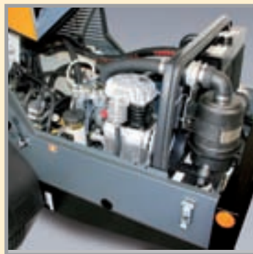
El número de revoluciones máx. del motor, de solo 2.600 r.p.m., y su óptima insonorización hacen de la SP 11 una máquina especialmente silenciosa.