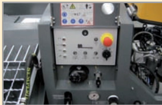
La SP 11 se controla desde el cuadro de mandos. La máquina cumple con los requisitos de la CE.