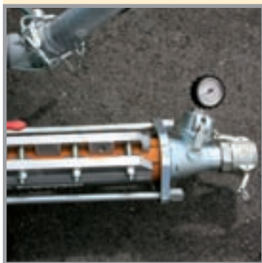
La potente bomba sinfin 2L6 con manguito de presión para conectar la manguera.

**Estos datos son valores de referencia y dependen del material empleado.